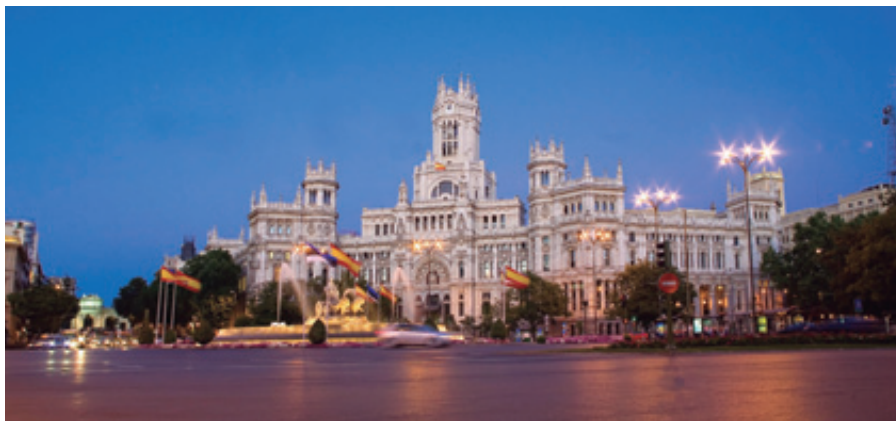
Palacio de Cibeles

El conjunto arquitectónico que forma el Palacio de Cibeles es un claro ejemplo de la arquitectura modernista ocupando 30.000 metros cuadrados de lo que en origen fueron los Jardines del Buen Retiro. La primera piedra del edificio se colocó en 1907, pero no se inauguraría oficialmente hasta el 14 de Marzo de 1919 por Alfonso XIII y su esposa Victoria Eugenia, como Palacio de Comunicaciones, cuya función era gestionar las comunicaciones y el transporte viario de la ciudad.