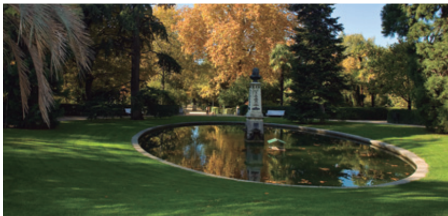
Jardín Botánico

Continuando desde la Plaza de Cibeles hacia la Puerta de Alcalá, llegamos a "El Retiro", un parque de 125 hectáreas y más de 15.000 árboles, que tiene su origen en 1630, cuando el Conde Duque de Olivares, le regaló al Rey Felipe IV unos terrenos para el recreo de la Corte que estuviera cerca del Monasterio de los Jerónimos de Madrid.