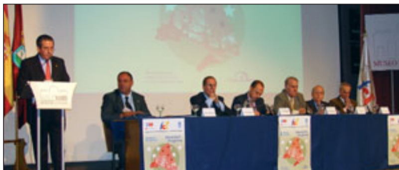
Clausura del congreso, celebrado en el salón de actos del Museo de la Ciudad.

FAPA "Francisco Giner de los Ríos" c/ Reina Mercedes, 22 28020 MADRID Telf.: 915 539 773/915 345 895 Fax: 91 535 05 95 www.fapaginerdelosrios.org e-mail: info@fapaginerdelosrios.es