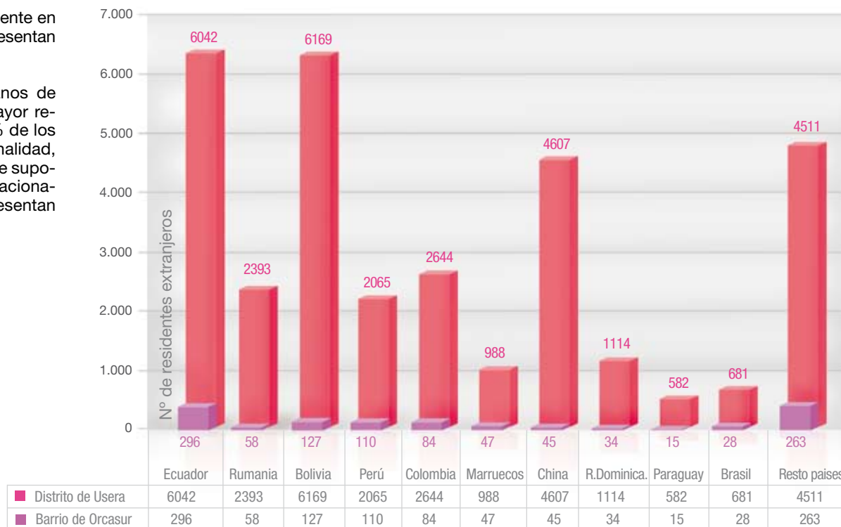
Gráfico Ciudadanos extranjeros residentes en el Distrito de Usera, y en el barrio de Orcasur.