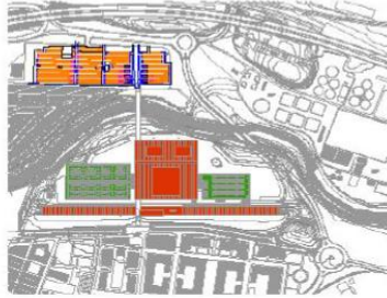
Piáno parking Embajadores con plazas