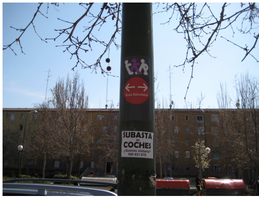
C/ Alberique, 18 F-1