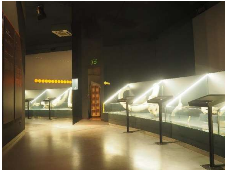
Imagen 117 Fauna asociada al Pleistoceno medio y superior.

Durante el Pleistoceno, en los últimos millones de años de historia de la Tierra, se han sucedido numerosos cambios climáticos, glaciaciones y periodos interglaciares, que determinaron la adaptación de animales y plantas. A través de los restos encontrados en las terrazas fluviales del río Manzanares y Jarama podemos observar restos que nos indican estos cambios. Se pueden observar algunos ejemplos como el cráneo de Uro ( Bos Primigenius ) o el cráneo de Rinoceronte Lanudo ( Caelodonta Antiquitatis ).