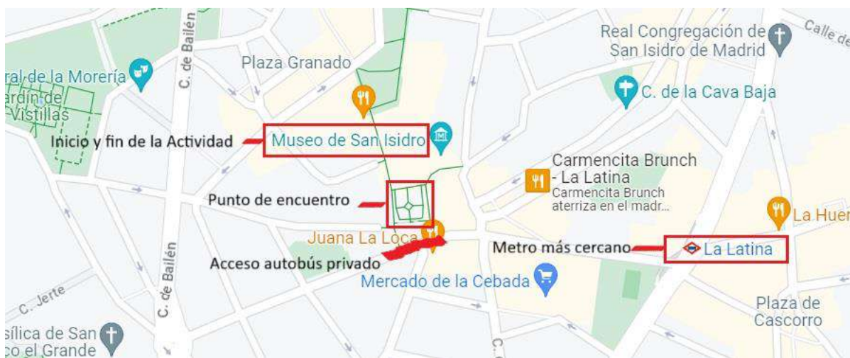
Mapa 1 Ubicación de los puntos de interés de la actividad.