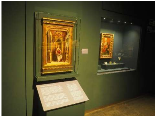
Imagen 27 Virgen de la leche . Pedro Berruguete (1500).

El cuadro máspreciado del museo es La Virgen de la leche de Pedro Berruguete. Es una de las obras más relevantes de este autor y donde se pueden observar influencias castellanas junto con las innovaciones renacentistas del siglo XV aprendidas en Italia.