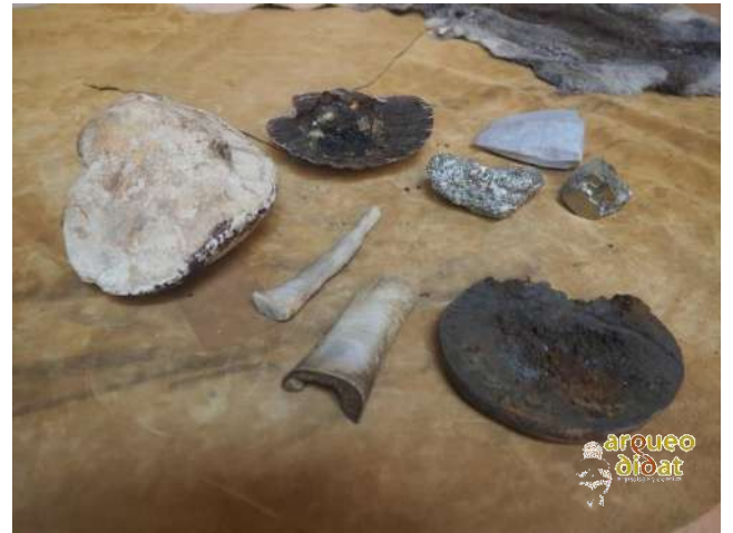
Imagen 11 Material de técnica de percusión para elaborar fuego. Huesos con marcas de sílex.