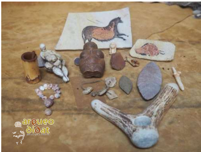
Imagen 12 Materiales de arte rupestre, arte mueble, talla en madera, asta y piedra y adorno personal con hueso y conchas.