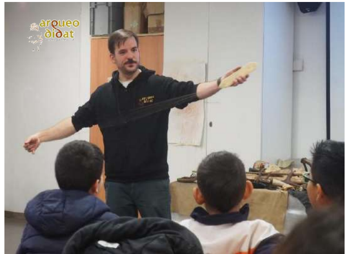
Imagen 8 Demostración de instrumentos musicales. Concha o caracola marina (izquierda) y zumbadora (derecha).