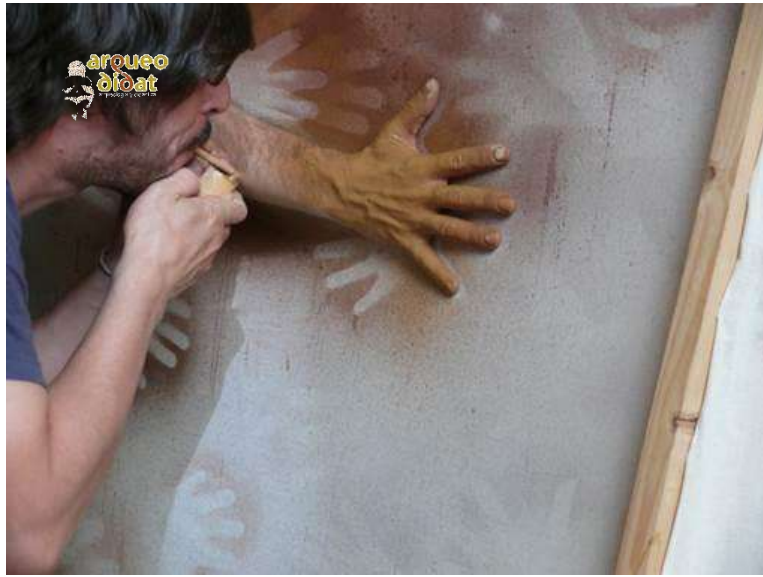
Imagen 7 Pintura de manos en negativo con ocre mineral mediante la técnica del aerógrafo.