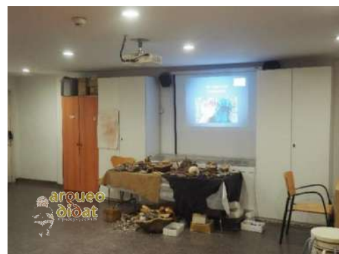
Imagen 1 Visión anterior y posterior del aula-taller.