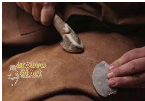
Imagen 2 Talla de sílex por percusión y elaboración de raedera Neandertal.

¿Qué implica la invención del metal? Se dan lugar las sociedades más complejas de la Prehistoria, aparecen las primeras ciudades, murallas o signos de violencia en huesos humanos. El metal es considerado un material valioso y reciclable y, por tanto, donde acumular horas de trabajo-riqueza. Es en este periodo cuando hallamos muestras de la aparición de las primeras élites y una simbología asociada. Las tres etapas de esta época son la Edad del Cobre (Calcolítico), la Edad del Bronce y la Edad del Hierro. A finales de esta última etapa, en distintas partes del mundo, comienza a darse lugar la escritura poniendo fin así a la Prehistoria.