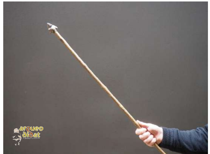
Imagen 5 Punta de piedra enmangada en lanza de madera con adhesivo de brea y tendón animal.