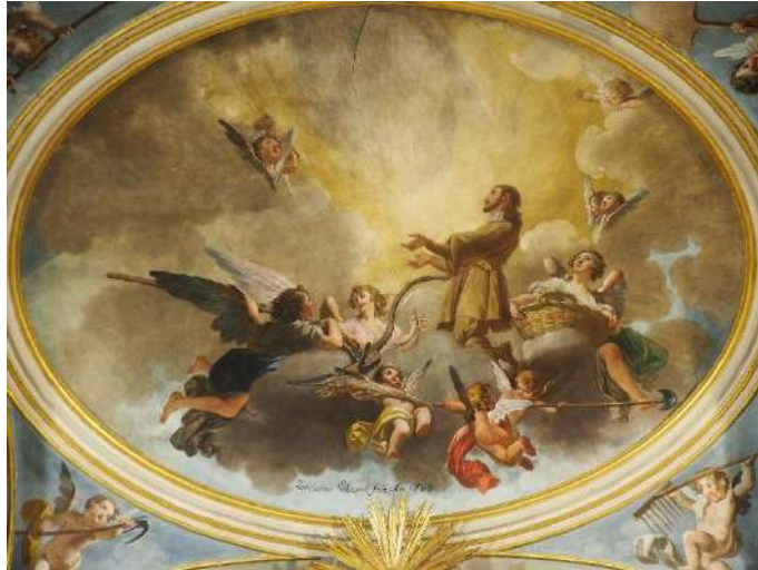
Imagen 30 Apoteosis de San Isidro. Zacarías González Velázquez (1789).

En la capilla se encuentran las antiguas representaciones del santo. San Isidro es canonizado en 1622 y su indumentaria se adapta a la del siglo XVII. Se observan los atributos más representativos de sus milagros, como la azada, la agujada o el arado de mano.