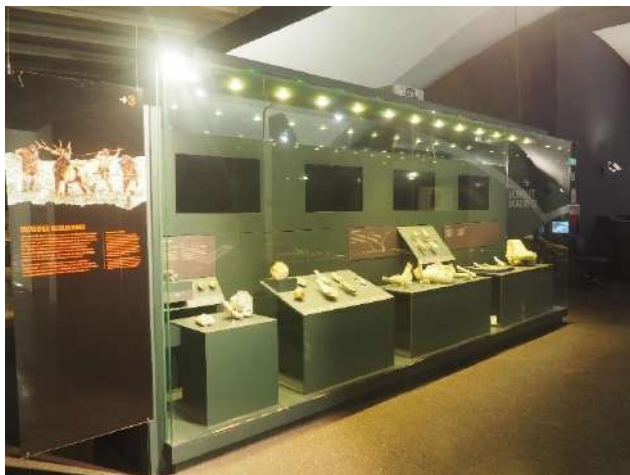
Imagen 18 Los homínidos más antiguos que poblaron Madrid.

Se observan los restos más antiguos del poblamiento humano en Madrid, de hace 400.000 años, pertenecientes a Homo heidelbergensis . Las principales pruebas de la presencia en Madrid son sus herramientas. Se observan distintos bifaces del Paleolítico inferior como el del yacimiento de Arenero de Oxígeno.