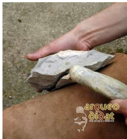
Imagen 3 Elaboración de bifaz con percutor de asta de reno.