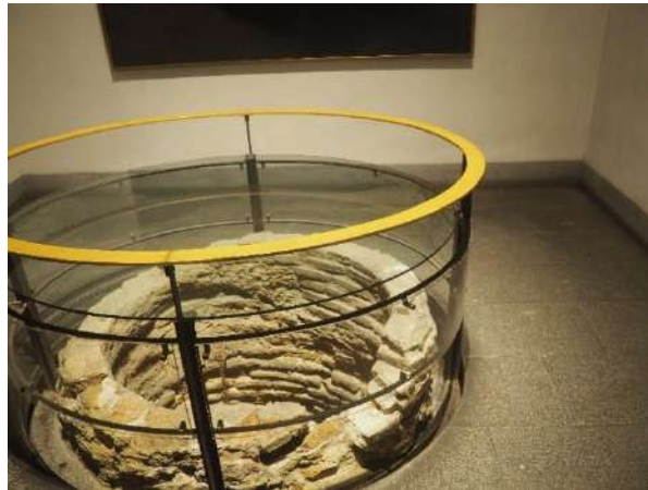
Imagen 28 Pozo milagroso.

En el antiguo Palacio de los Condes de Paredes, actual museo, se encontraba la casa de Iván de Vargas donde vivían el patrón, San Isidro y su mujer, Santa María de la Cabeza, en el siglo XII. Según cuenta la tradición el hijo de San Isidro cayó al pozo y por el miedo de ver a su hijo ahogado, San Isidro empezó a rezar a la Virgen y las aguas del pozo brotaron permitiendo recuperar al niño sano y salvo. Este milagro no se conocerá hasta finales del siglo XVI cuando comience su popularización.