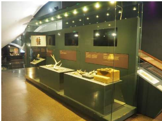
Imagen 19 Nuestros primeros antepasados: Homo sapiens .

Se observan los restos más antiguos del poblamiento humano en Madrid, de hace 400.000 años, pertenecientes a Homo heidelbergensis . Las principales pruebas de la presencia en Madrid son sus herramientas. Se observan distintos bifaces del Paleolítico inferior como el del yacimiento de Arenero de Oxígeno.