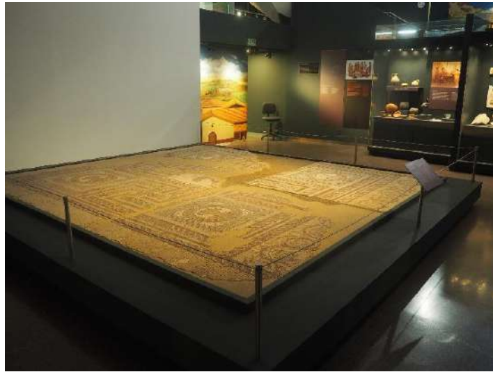
Imagen 22 Mosaico geométrico del cubículo de la villa de Villaverde Bajo, siglo IV.

Debido a la situación central de Madrid, este territorio se convierte en un enclave de comunicaciones en época romana. Destacan la Villa romana de Villaverde y el mosaico de las cuatro estaciones del siglo IV-V procedente de la Finca de los Condes de Montijo en Carabanchel.