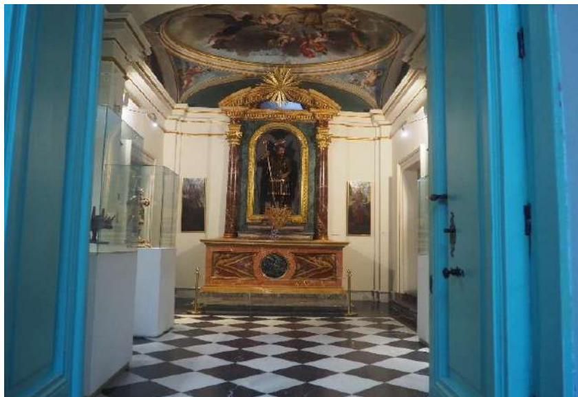
Imagen 29 Capilla de San Isidro.

En el antiguo Palacio de los Condes de Paredes, actual museo, se encontraba la casa de Iván de Vargas donde vivían el patrón, San Isidro y su mujer, Santa María de la Cabeza, en el siglo XII. Según cuenta la tradición el hijo de San Isidro cayó al pozo y por el miedo de ver a su hijo ahogado, San Isidro empezó a rezar a la Virgen y las aguas del pozo brotaron permitiendo recuperar al niño sano y salvo. Este milagro no se conocerá hasta finales del siglo XVI cuando comience su popularización.