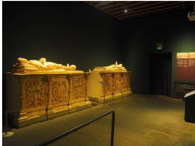
Imagen 26 Cenotafios de Don Francisco Ramírez y de Doña Beatriz Galindo. Hernán Pérez de Albiz (1530).

Tras el traslado de la corte en 1561, se realizan grandes actividades urbanísticas como la remodelación del Alcázar y la construcción del nuevo puente de Segovia, por lo que muchos nobles comienzan a vivir en la ciudad. Se observan dos cenotafios en alabastro de Don Francisco Ramírez y Doña Beatriz Galindo, quien fue llamada a la corte desde Salamanca con la edad de 16 años para convertirse en maestra de Isabel la Católica y en su fiel consejera.