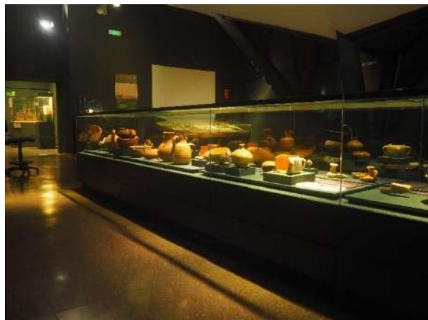
Imagen 23 Materiales de vida cotidiana en el Madrid andalusí.

Mayrit fue fundada a mediados del siglo IX por Muhammad I, quien construyó una muralla con el fin de frenar los avances militares cristianos hacia Toledo y preparar las razzias al territorio castellano. Se observan multitud de materiales de la vida cotidiana en el Madrid musulmán procedentes de la Cuesta de la Vega como el Atafor (fuente) con la inscripción “Todo el Poder” referente a Alá, un jarro, un peón de ajedrez o un omóplato de vaca con inscripciones en árabe.