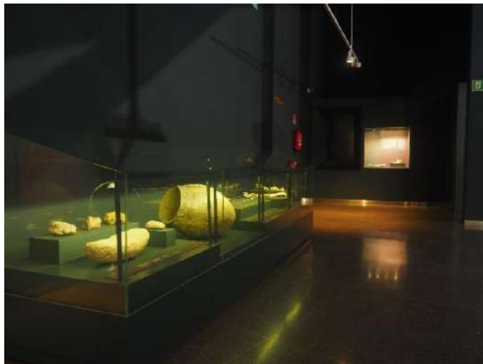
Imagen 20 Materiales asociados al Calcolítico.

El paso a una vida sedentaria fue consecuencia de los cambios hacia la agricultura y ganadería, lo cual afectó al comportamiento humano. Se desarrollan nuevas herramientas, técnicas y mayor especialización. Se observan materiales como la punta de flecha de sílex del Poblado de El Ventorro del Calcolítico, o la vasija de almacenamiento de Tejar del Sastre del Bronce medio. Ambos provenientes de Villaverde. Se observan nuevas técnicas como la abrasión de la piedra o el uso de pesas de telar y fusayolas para el trabajo de la lana.