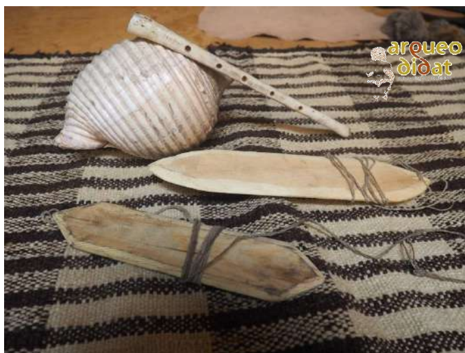
Imagen 14 Instrumentos musicales. Concha marina, flauta de hueso de buitre y zumbadora.