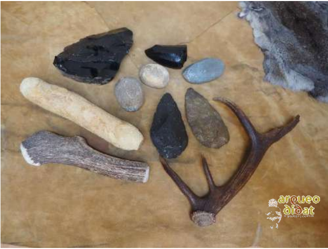
Imagen 10 Bifaz de sílex y basalto. Núcleo troncopiramidal de obsidiana. Percutores de piedra, madera de boj y asta de ciervo.