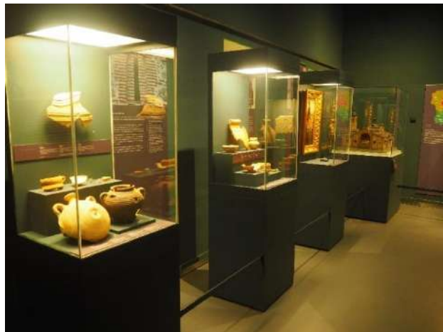
Imagen 25 Materiales de la vida cotidiana durante la época medieval en Madrid.