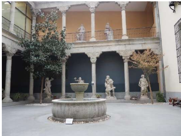
Imagen 31 Patio renacentista.

En la capilla se encuentran las antiguas representaciones del santo. San Isidro es canonizado en 1622 y su indumentaria se adapta a la del siglo XVII. Se observan los atributos más representativos de sus milagros, como la azada, la agujada o el arado de mano.