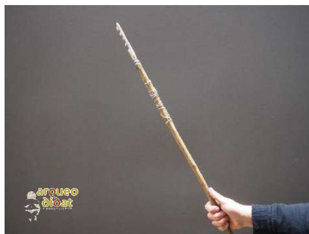
Imagen 6 Arpón tallado en hueso enmangado mediante cuerda en un palo de madera trabajada.