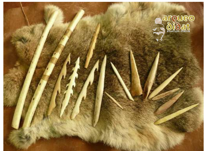
Imagen 13 Industria ósea.