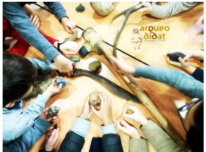
Imagen 9 Colección de réplicas (izquierda) y grupo escolar manipulando materiales (derecha).