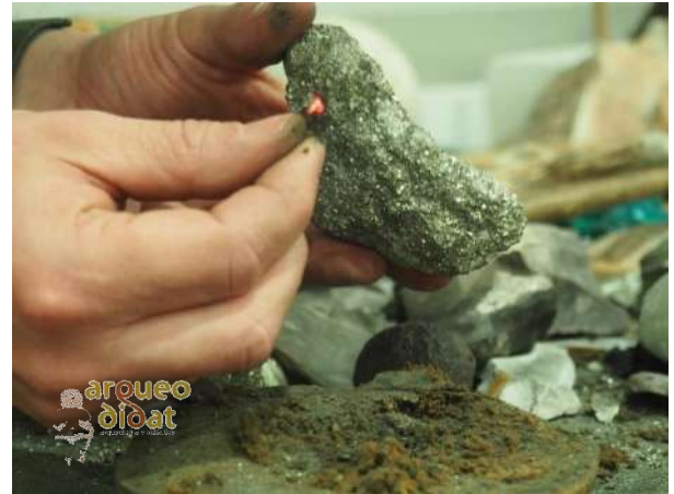
Imagen 4 Elaboración de fuego mediante la técnica de percusión de pedernal y pirita sobre hongo yesquero.