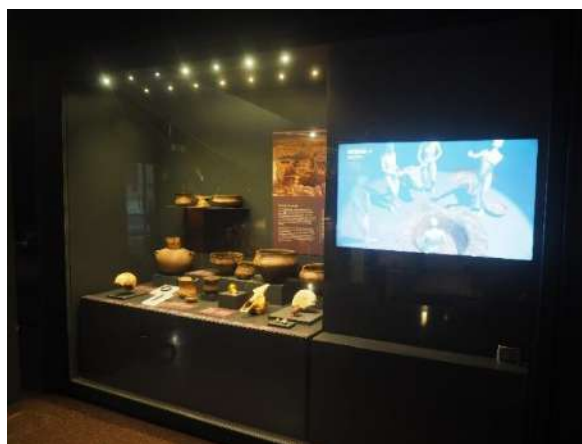
Imagen 21 Simbología de poder. Vitrina asociada a la Edad del Bronce.

Surgen élites, uso de símbolos de poder y materiales que se relacionan con rituales de enterramiento. Muestra de ello son los restos arqueológicos de la cultura del Vaso Campaniforme en Ciempozuelos del Bronce Inicial o los restos encontrados en el poblado de La Fábrica de Ladrillos en Getafe del Bronce Final.