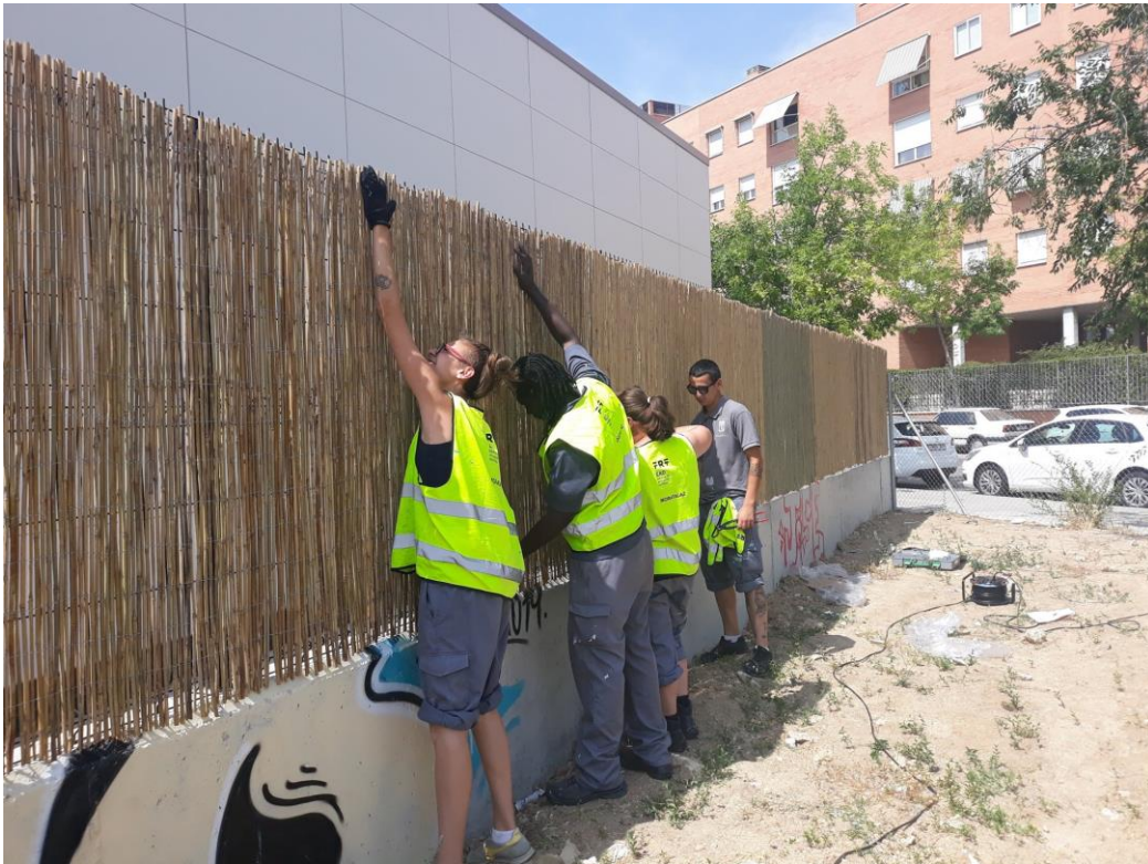
La “Asociación de Vecinos Avance de Moratalaz” se ofrecieron a instalar brezo para preservar la intimidad.