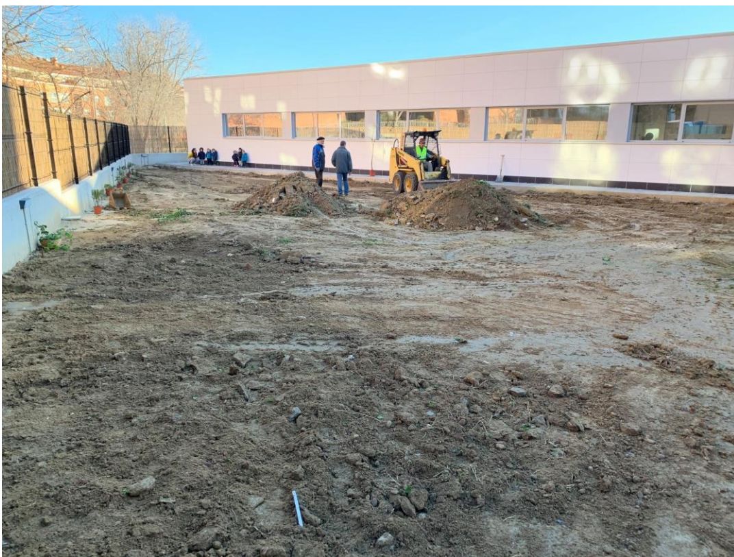
Más tarde se preparó el suelo, dejándolo limpio de objetos punzantes y cortantes, y creando dos colinas aprovechando la tierra removida.