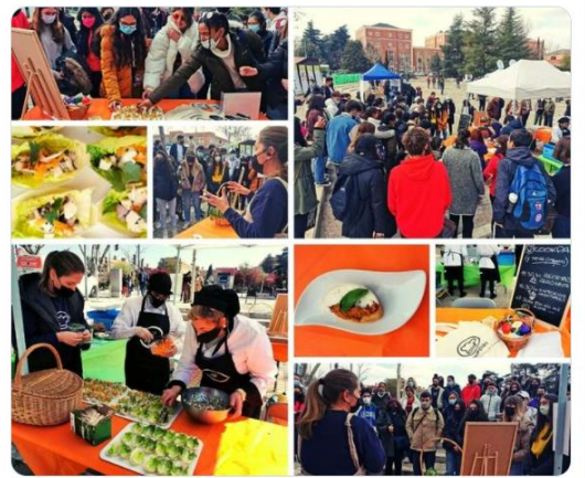
2:14 p. m. · 7 abr. 2022 · Buffer

Cookpad Recetas @cookpadrecetas Y fue un gran día en #MerCAMPUS de cocina, alimentación y nutrición con productores, estudiantes, activistas y la comunidad de #CookpadRecetas disfrutando de nuestras tapas y talleres en el corazón de @UniComplutense! Gracias a @MADRID y a #foodwaveproject! Hasta la próxima!