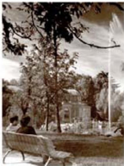
170. Tomás Guzmán 1964