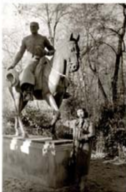
136. Inland Empire 1956