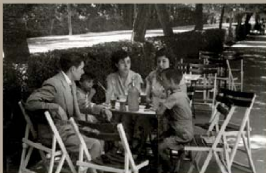
6. Carreras de las Heras - 1953