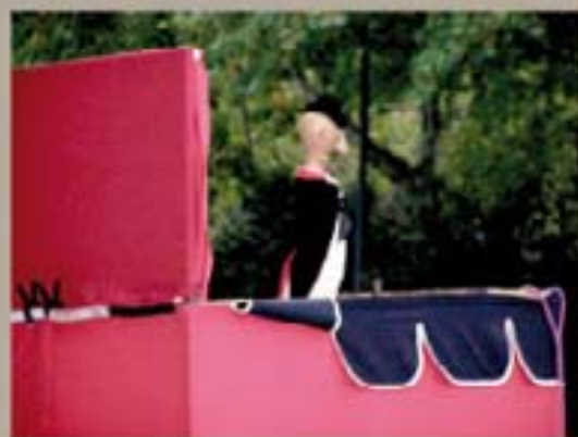
263. Beatriz Escuderos 2009