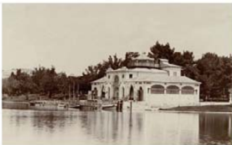
17. Museo Fernández 1900