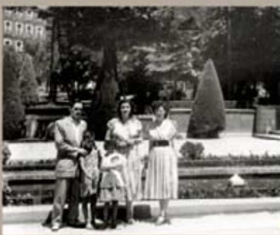
9. Carreras de las Heras - 1953