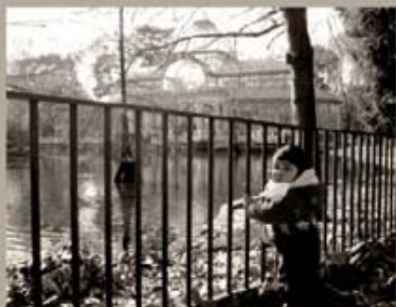
230. Jaime Castro (2004)