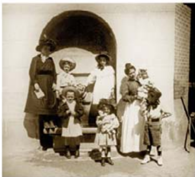
13. Museo Fernández 1900