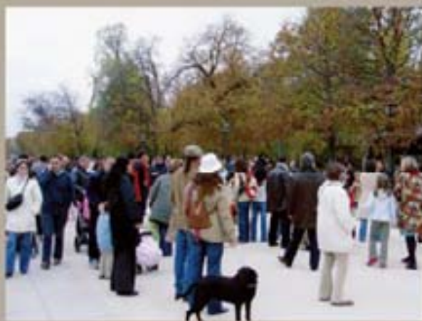
277. Santiago Atlixco, 2006