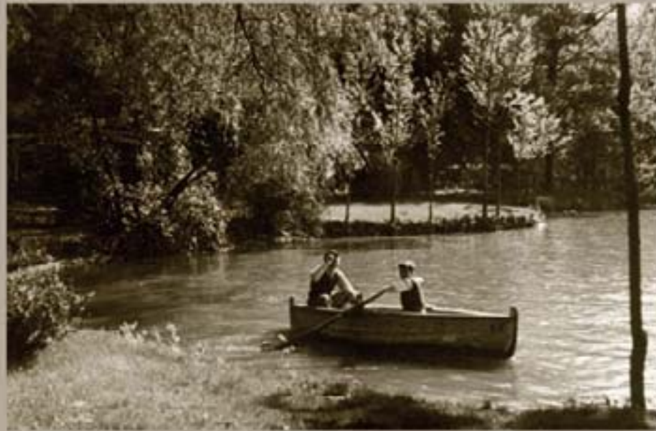
134. Nueva Espargana 1948