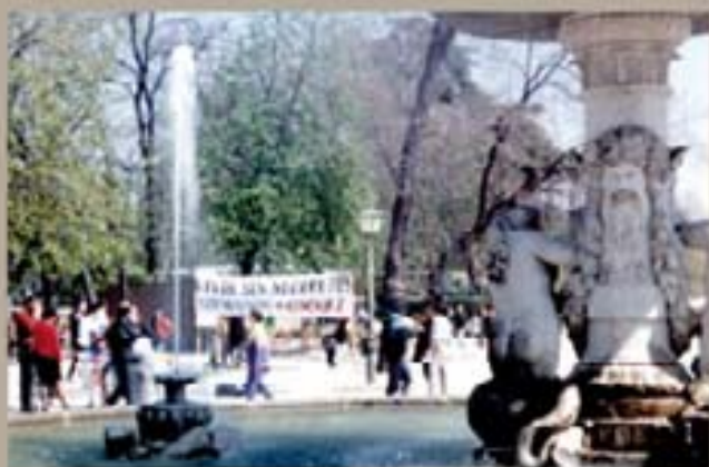
253 - Ciudad Ponce (1991)