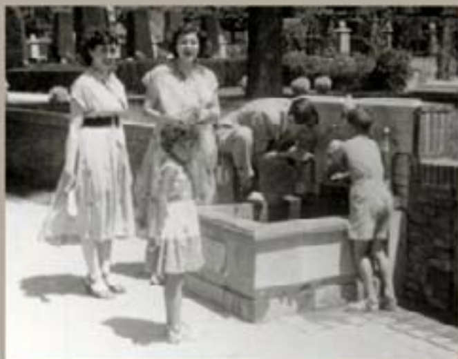
1. Carmen y la Hiena - 1953