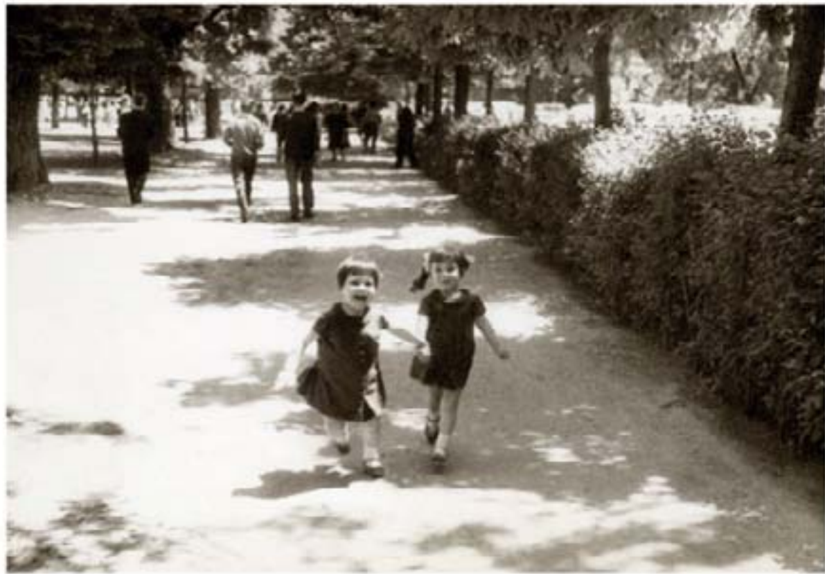
177. Dacia Ingurilo 1964