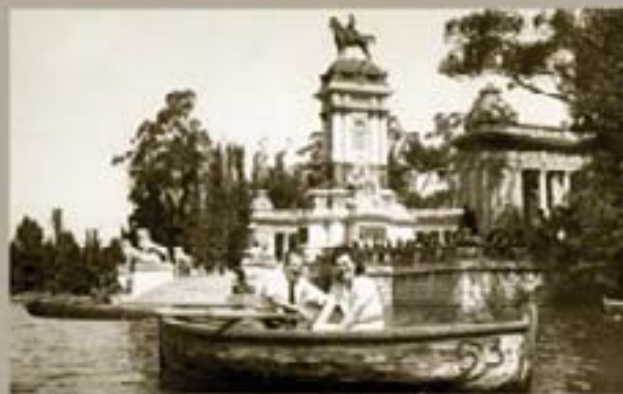
137. Nueva Espargana 1941