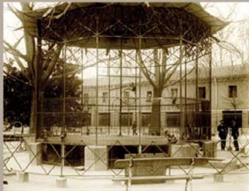
193. Museo Ferrnández 1914