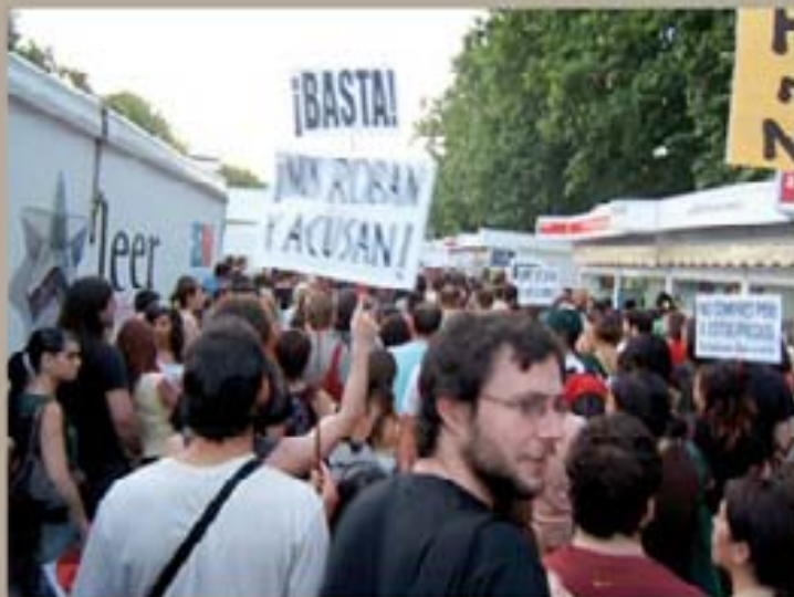
255 - La Candelaria 2006