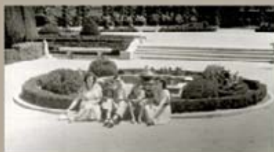
7. Carreras de las Heras - 1953

Gracias a su significativa popularidad, desde su apertura plena en 1868, el Retiro asume la función preeminente de parque público de Madrid por excelencia. Asimismo se convierte en el conjunto de jardines más fotografiado de la ciudad, de tal modo que casi todos los álbumes de fotos de los madrileños de todas las edades y barrios de Madrid, guardarán entre sus páginas al menos una fotografía que recoja un instante cordial de un día transcurrido en el Retiro.