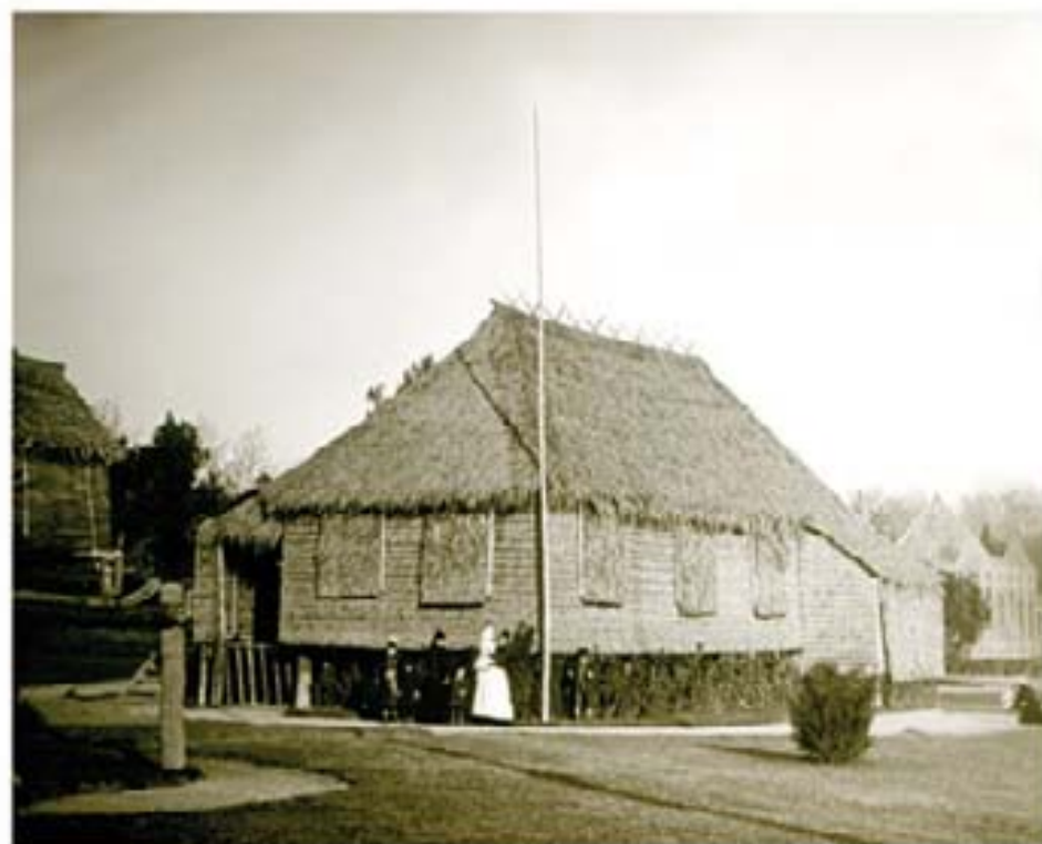
16. Museo Fernández 1900