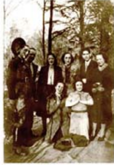
82. Judo Dize, 1940.