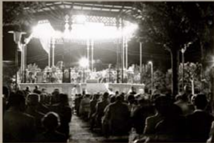
272. - Fırıldak Garması 1935