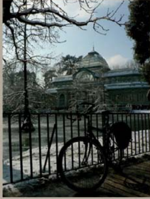
234 - Reportaje del Día 2005