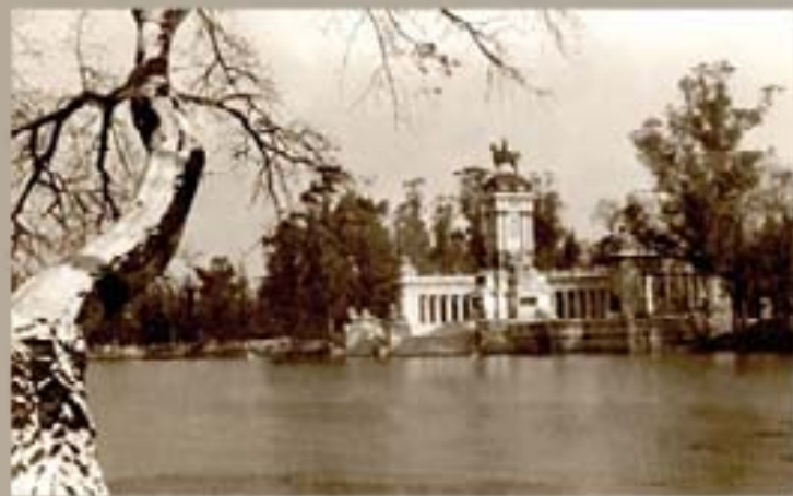
71. Santiago Calatrava 1993