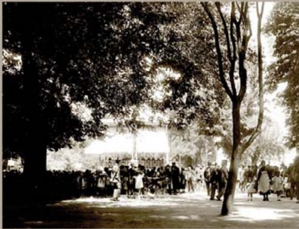
270. - Kazanlar Garması - 1923