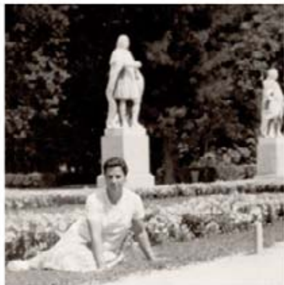
110. Aurora Muñoz 1966

Paseo de las Estatuas Esta espectral estatua inmortaliza a Doña Berenguela, reina de Castilla en el siglo XIII. Es una de las trece efigies monumentales de reyes y reinas de España que conforman el Paseo de las Estatuas. Todas ellas provienen del Palacio Real, en cuyo entorno podemos encontrar otras similares. A mediados del siglo XVIII formaron parte de un conjunto de aproximadamente cien estatuas que Felipe V mandó realizar para decorar el exterior del palacio y su balaustrada y que Carlos III decidió desmontar al comienzo de su reinado. En otros tiempos hubo más esculturas de esta serie por el Retiro, de suerte que en algunas fotografías de este libro podremos encontrarlas en el Parterre o en la Puerta de Hernani.