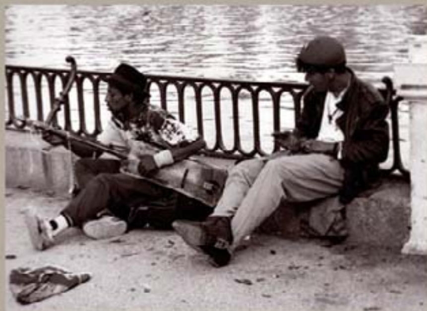
278. Tlatelolco, 1999