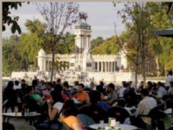
212. Buenos Escondido 2009