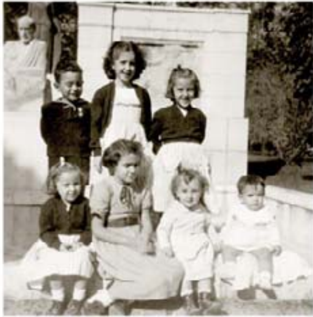
111. Tierra de la Rabosa 1956