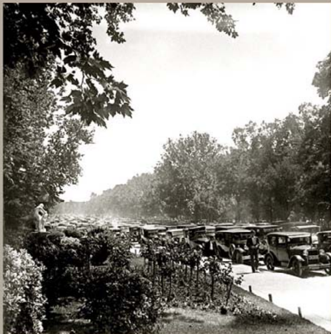
248 - Museo Fernández, 1991