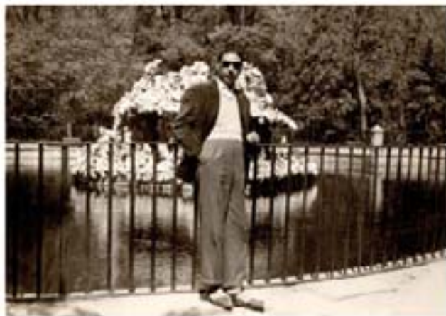
134. Barbours Nursery 1954