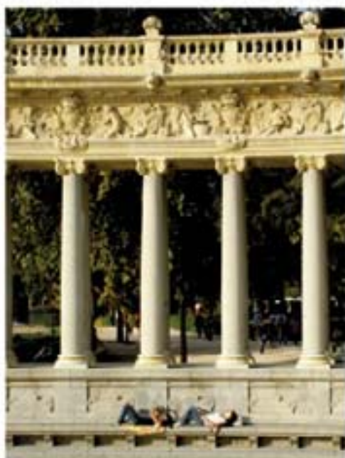
254. Bruno Escobedo 2009