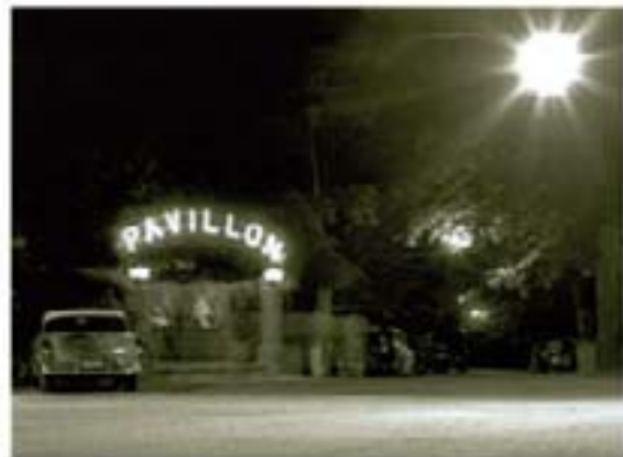
133. Tennis Grounds 1953