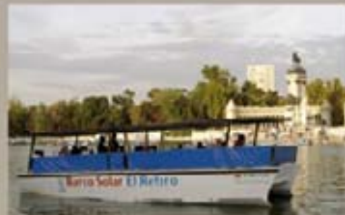
166. Barrio Solar 2010