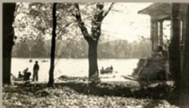
130. - Nieves Betanaga 1948