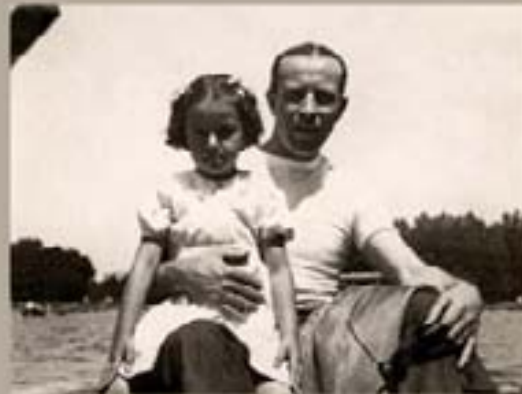
138. Comandante Espargana 1944