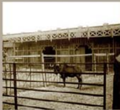
191. Museo Ferrnández 1914