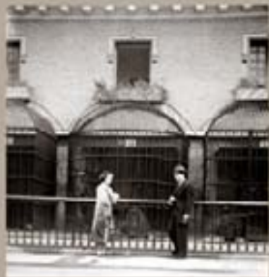
197. Eugenio Lázaro 1944