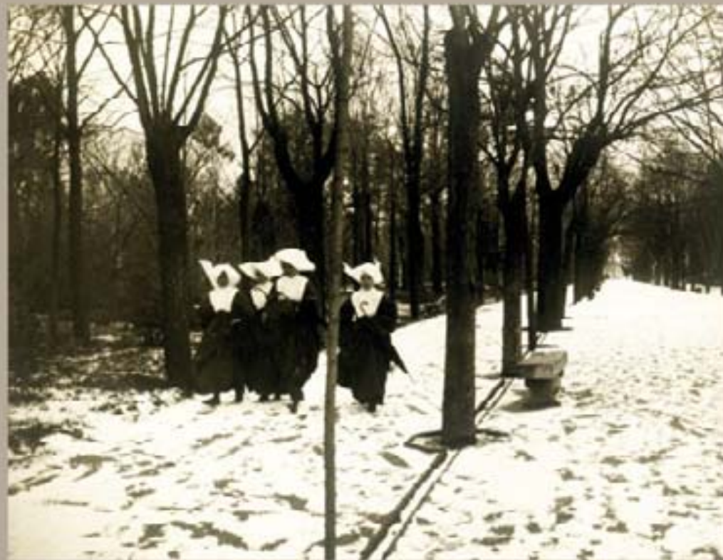
70. Navro Bermejo 1920