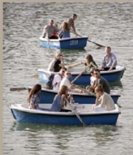
168. Barrio Solar 2009