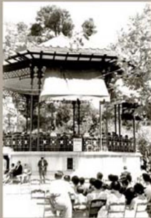
271. - Minskul Göl 1939