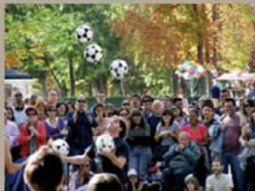
280. Benito Juárez, 2007