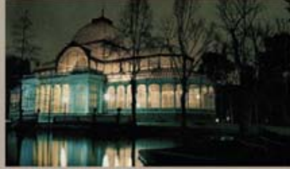
233 - Santiago García 2007