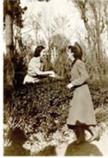
81. Judo Dize, 1940.