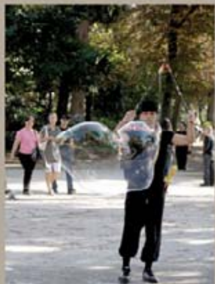
279. Benito Juárez, 2007