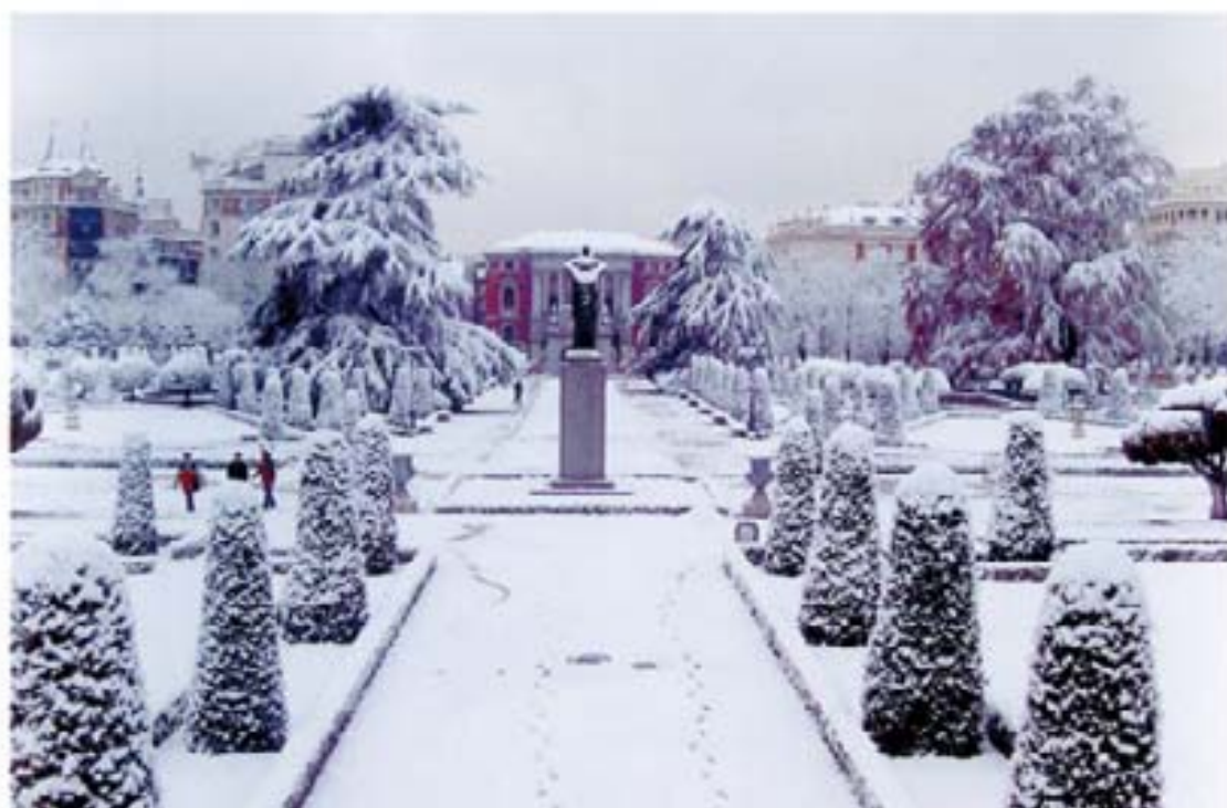
243. Muello Ibarra 2005