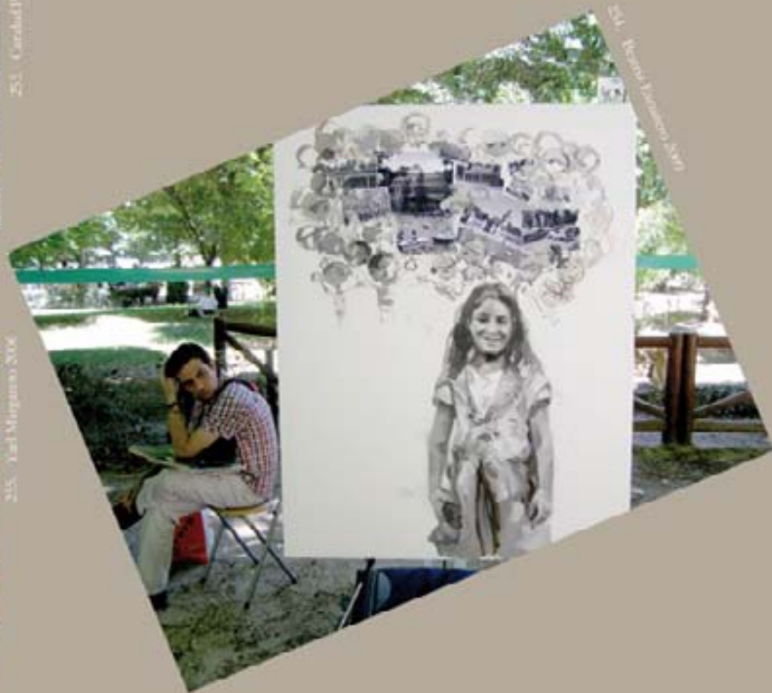
257 - La Candelaria 2006