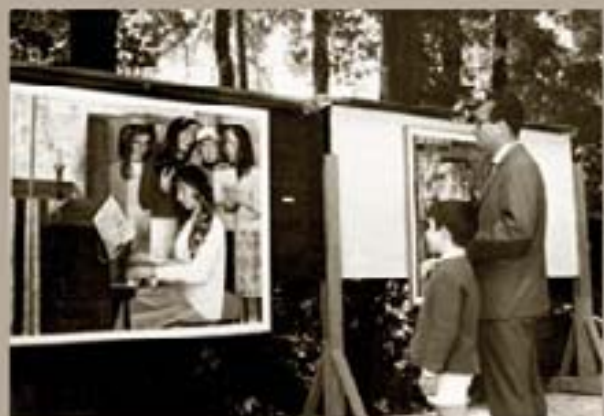
247 - Museo Fernández, 1991