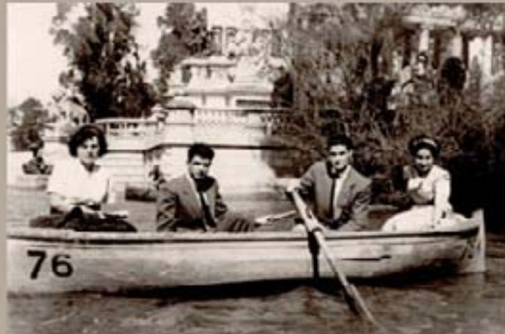
135. Nueva Espargana 1945