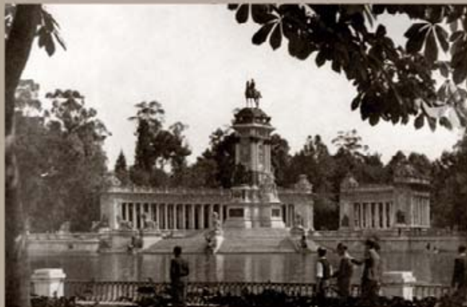
209. Nueva Bernabérga 1944