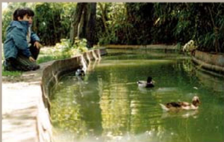
297. Virginia Valverde, 2004