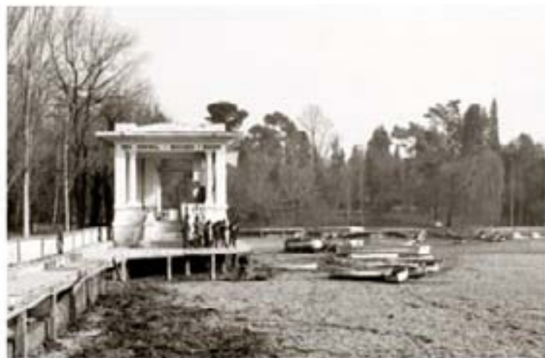
148. Tomás Guzmán 1959