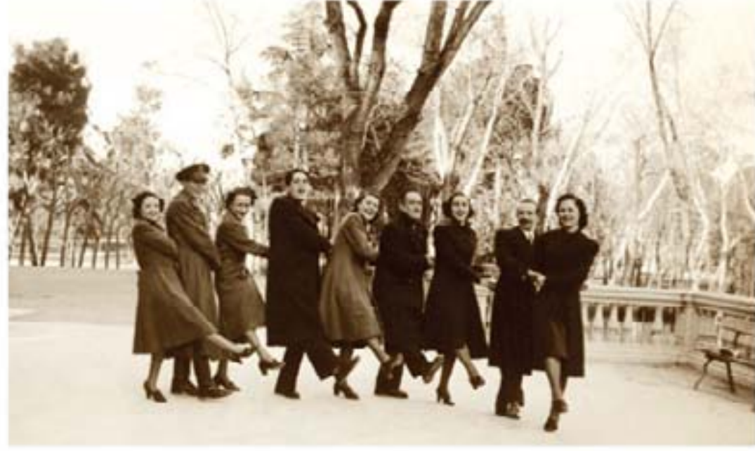
80. Judo Dize, 1940.