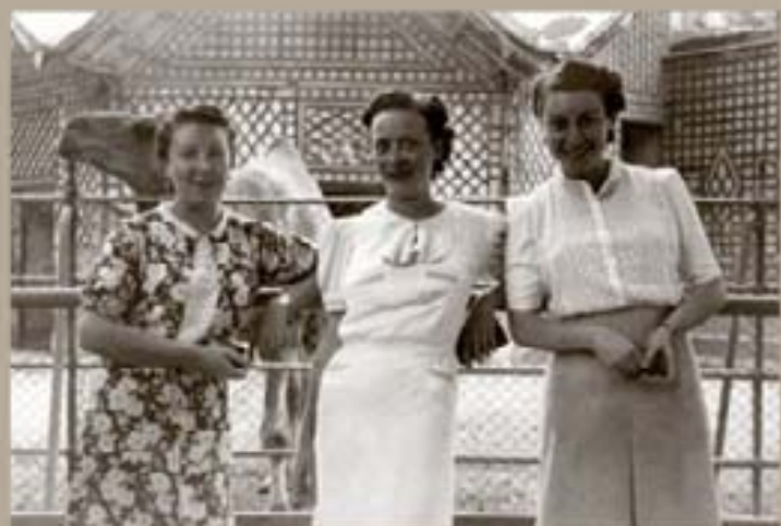
196. Jesús Díez 1940

Casa de Fieras Jirafas y leones en blanco y negro, flamencos virados en tono sepia, o dromedarios en colores pastel años sesenta, son algunos de los animales inmortalizados en este zoológico fotográfico y, posiblemente, los primeros animales exóticos reales con los que se toparon los visitantes del primer zoo de Madrid: la antigua Casa de Fieras.