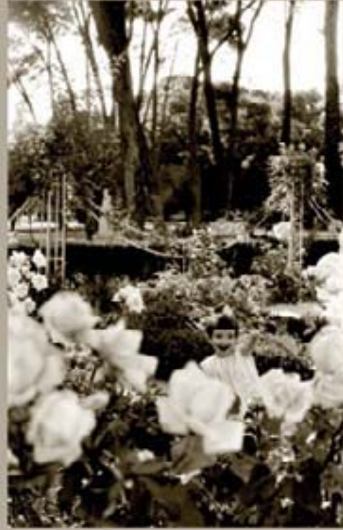
26. - Norma Ferrerías 1961