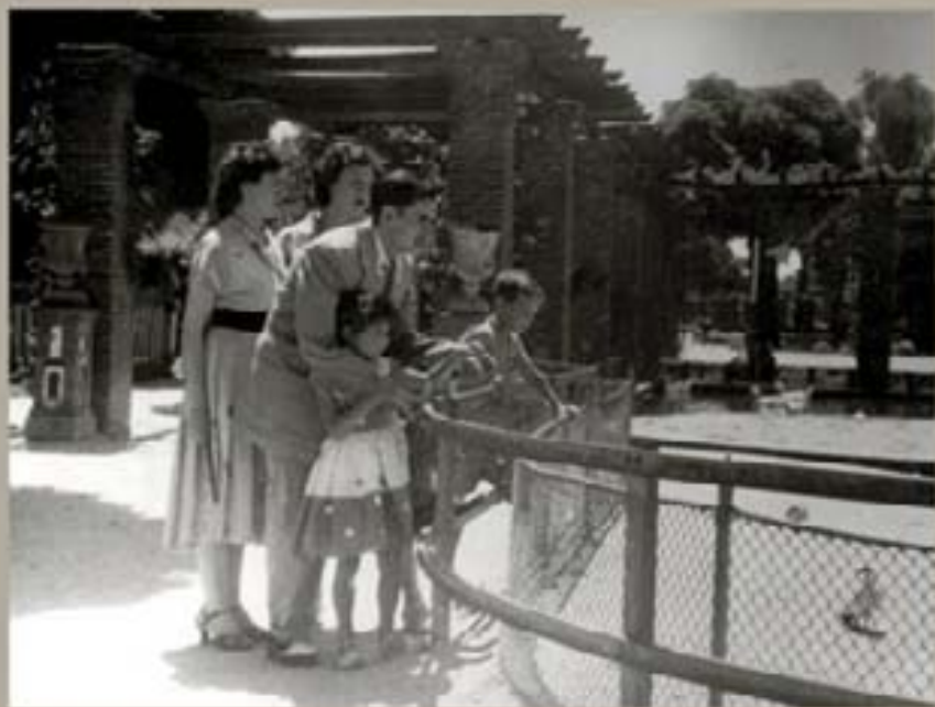
2. Carmen de la Hiena - 1953