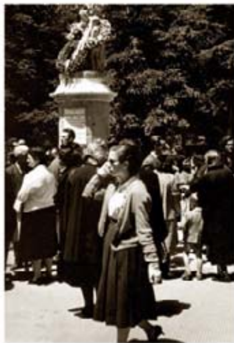
146. Nantuxel Col. 1959