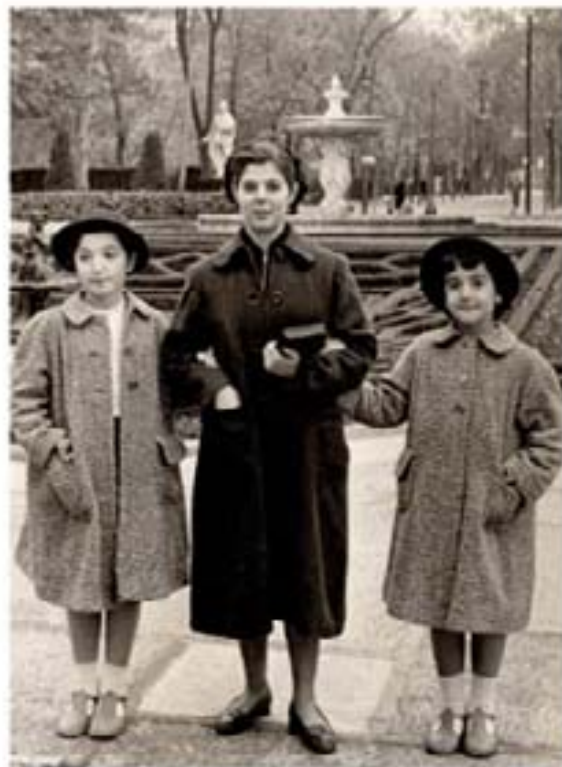
135. Man Carve in Silhouette 1955