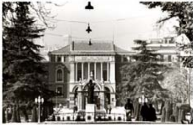
237. - Mercuriales Babilonia 1982