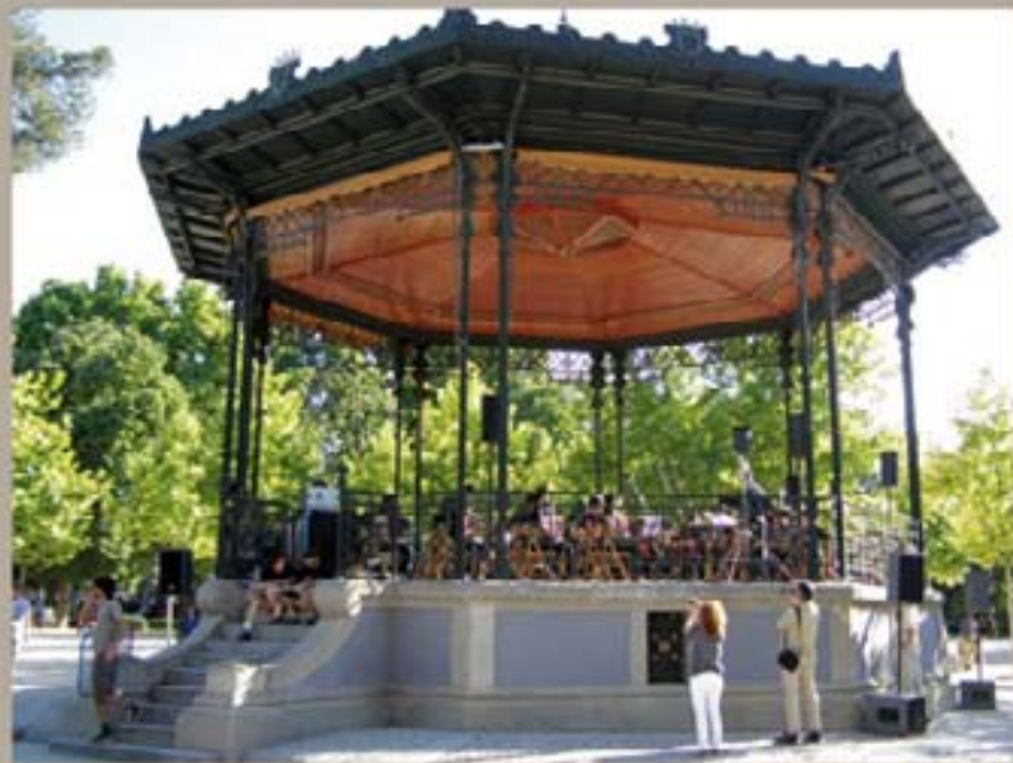
276. - Iborra Escobedo, 2009