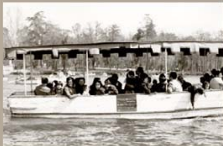
167. Barrio Solar 1973