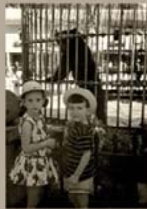
192. Museo Ferrnández 1966