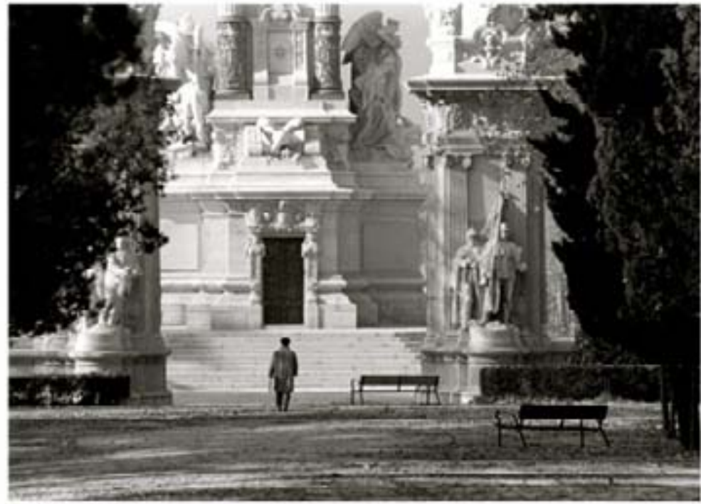
238. - Mercuriales Babilonia 1982