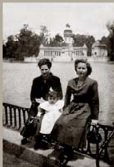
210. Churriguera - 1948