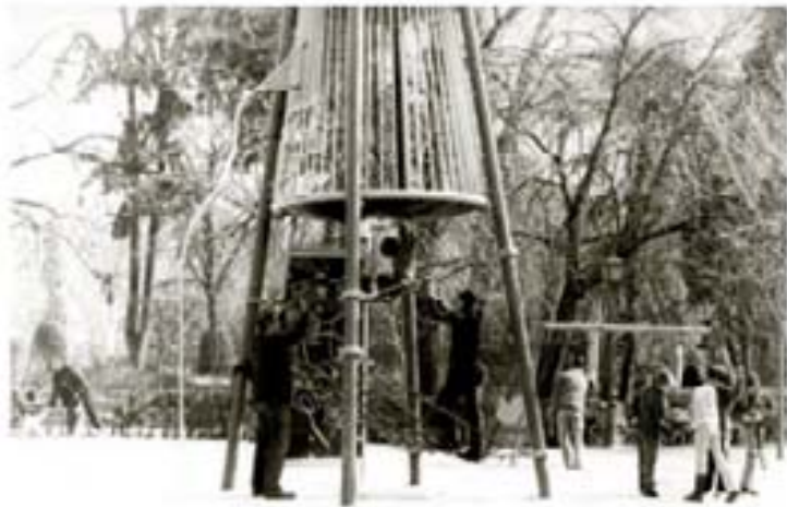
264. Laura Noriega 2003