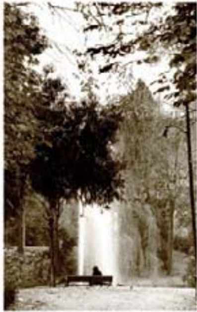
239. - Mercuriales Babilonia 1982