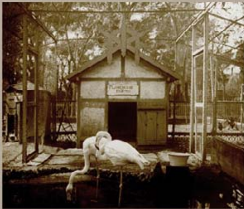
190. Museo Ferrnández 1914