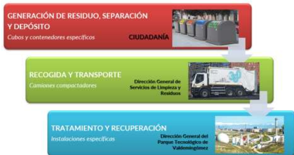
Proceso básico de la gestión de residuos en la ciudad de Madrid

Con este objetivo, el Ayuntamiento de Madrid trabaja para minimizar los residuos producidos, y mejorar el aprovechamiento de los que se generan, reduciendo su impacto ambiental. La ciudad de Madrid cuenta con un conjunto de infraestructuras de recogida, transporte, tratamiento y valorización de los residuos domésticos y comerciales que figura entre los más completos y avanzados de Europa.