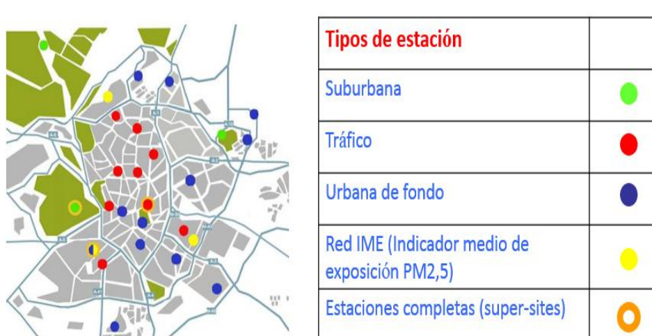
Fig. 1.- Esquema de la red actual de estaciones de vigilancia de la calidad del aire.

La distribución y tipología de estaciones de la red de vigilancia actual permite una adecuada evaluación de la calidad del aire en nuestra ciudad y así ha quedado de manifiesto con la participación de la ciudad de Madrid en proyectos coordinados por la Agencia Europea de Medio Ambiente como el “Air Implementation Pilot. Lessons learnt from the implementation of air quality legislation at urban level”.