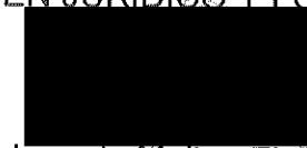
Ignacio Molina Florido

EL DIRECTOR GENERAL DE ORGANIZACIÓN, RÉGIMEN JURÍDICO Y FORMACIÓN